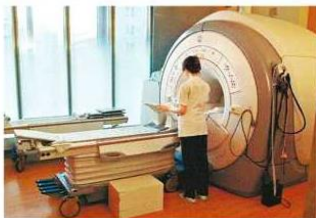
脳ドックの頭部検査で使うMRI＝名古屋市中区の中日病院で