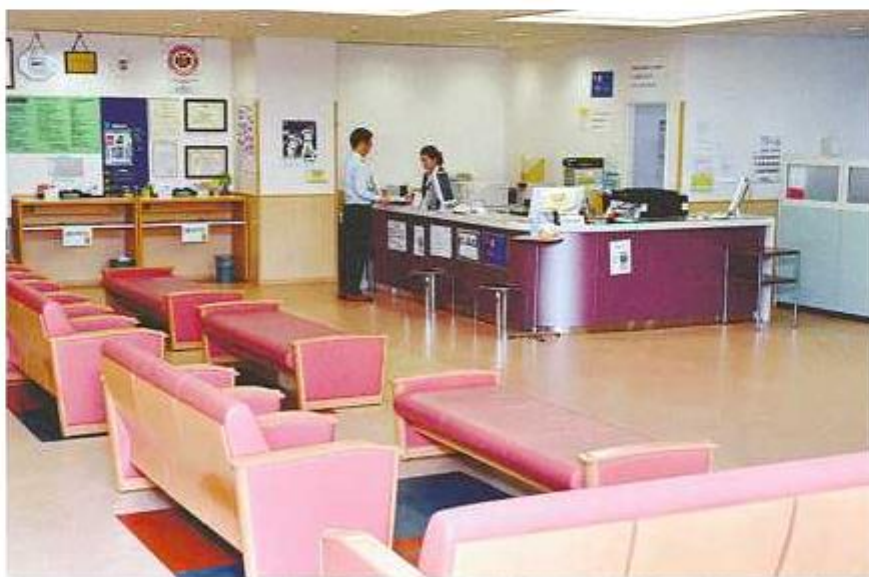
中日病院の健診センターの受付＝名古屋市中区で

は見つけにくいものもあ ります。医療機関が独自 に備えているコンピュー ター断層撮影(CT)で の検査が有用です。 治療が可能な段階で早 期がんなどを発見するこ ん検診」のように、自治